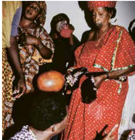
Die Rassel wird hart am Ohr des Protagonisten geschüttelt, bis dieser den Namen des Rab sagt.

Islamische und christliche Missionare haben die afrikanischen Religionen bekämpft und abgewertet. Dabei wirkten sich die christlichen Missionen im Vergleich zerstörerischer aus. Aus Geistern und Göttern wurden Dämonen, mit denen man nichts zu tun haben soll. Die Psychiatrie trat zunächst in diese Fussstapfen. Doch die afrikanischen Religionen wirkten zurück. Der ursprünglich eingeführte, international organisierte Protestantismus wandelte sich zu mehr oder weniger fundamentalistischen Pfingstkirchen, die ihre Gottesdienste in kleinen Gemeinschaften ohne organisatorischen Überbau und kodifizierte Dogmatik feiern. Zur Zeit meiner Feldforschung Ende der 1990er Jahre wurden im südlichen Ghana fast täglich solche Kleinstkirchen gegründet. Und mit dem Vormarsch des Pentecostalism kehrte die Besessenheit ins afrikanische