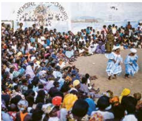
Einleitend tanzen die Ritualleiterinnen.

Das Ritual beginnt Sonntagnacht in einem kleinen Zimmer. Die Protagonistin, die schweigsam geworden ist und sich gern zurückziehen würde, sitzt in der Mitte, bedrängt von den engsten Verwandten und einer Trommlergruppe. Die Luft ist stickig heiss. Die Trommler eröffnen. Der Tiefpunkt. Die Protagonistin muss sich vor allen Augen ausziehen. Sie ist erniedrigt. Die Ritualleiterin reibt sie mit Joghurt, Speichel und anderen Substanzen ein, welche die Geister mögen. Dann fragt sie nach dem Namen des Rab , der angegriffen hat. Die Protagonistin drückt sich. Sie weiss, wenn sie den Namen sagt, fährt der Rab wieder in sie ein. Dann wird der Druck der Familie zu gross. Sie muss den Namen sagen. Ihre Augen drehen nach oben. Ihr Oberkörper wippt vor und zurück, immer heftiger, als ob sie ruderte. Die Trommeln treiben sie mit dem Rhythmus an, der zu ihrem Rab gehört. Dann steht sie auf, wird angekleidet und tanzt zum ersten Mal. Feierlich schreitet oder tanzt sie voraus in den Hof, wo der grosse Familienkreis sie klatschend erwartet. Nach der Erniedrigung gleich das erste Hochgefühl. Dieses Muster wiederholt sich vielfach im Lauf des Rituals.