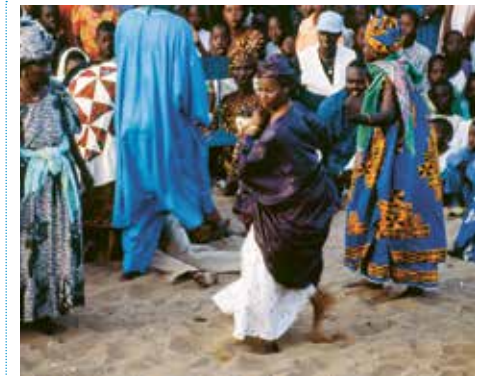
Der Tanz der Besessenen beschleunigt sich. Im Hintergrund am Boden ein Tänzer, der bereits zusammengebrochen ist

Inzwischen hat man im Geisterhaus die Löcher für die Altäre der Rab gegraben. In jedes kommt ein Stück vom Stier. Dann bekommt jedes Familienmitglied seinen Teil. Die Protagonistin wird mit Blut eingerieben und mit den Innereien geschmückt. Der Magen wird ihr als Mütze über den Kopf gestülpt. Sie muss diese Teile des Opfertiers bis Freitag auf der Haut tragen.